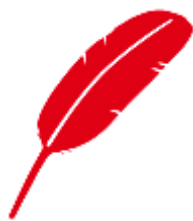
指定の赤い羽根のマーク