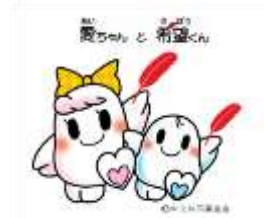
共同募金シンボルキャラクター「愛ちゃんと希望くん」