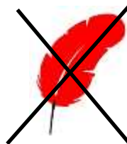
指定以外の羽根を使用しない