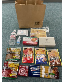
袋に詰め、配布を行います