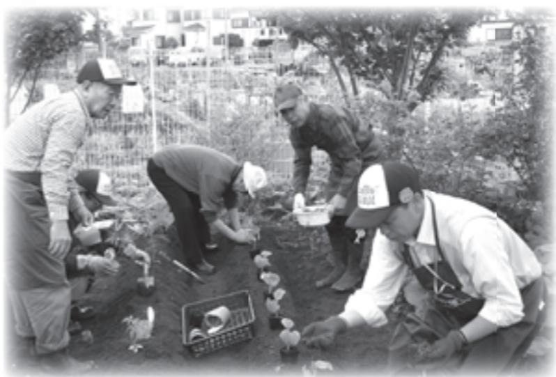
皆さんで協力し合って丁寧に植えつけていきます。

新緑が目まぶしく初夏の花が街角のあちこちで咲き出すこの季節。その風景は時に人の心を癒してくれるものです。園芸療法ではこの草花の癒し効果に着目し、植物の世話を通して自然と触れ合うことによる心身機能の回復・維持を目指し、さらには日の光や風を体に感じることで五感を刺激し、長いホーム生活で失いがちな見当識(※1)を補うことを目的としています。