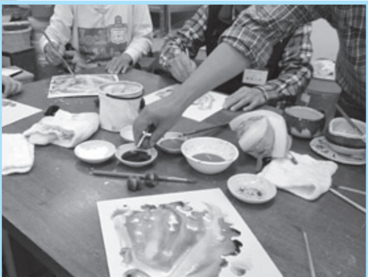
絵の具を含ませたスポンジで葉を描き、割り箸と鉛筆で茎を描きます。手を汚しながらの作業は懐かしさも新鮮な感覚!