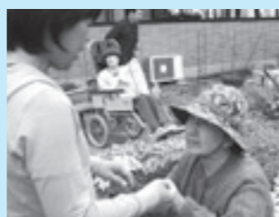
花壇に腰掛けて歌を歌っています。

畑はあらかじめ耕され、苗の入ったポットと肥料が均等に置かれています。植え付け作業が開始されると、自ら進んで畑に入っていく方、畑の周りをスタッフと手をつなぎながら散歩する方、庭に咲くバラを摘んでもついでに「顔の方、枝から落ちたくらんぼを手のひらに乗せて眺めている方…。通り方は様々ですが、皆さんの笑顔が印象的です。