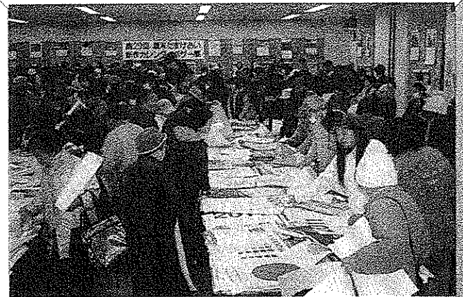
カレンダーバザー展の様子