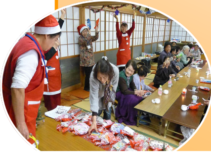
地域サロンでのクリスマス会の様子