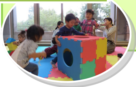
ソフトブロックで遊ぶ子供たち （子育てサロンにて）

（例）広報誌の音訳・編集のためのパソコン 福祉教育のためのプロジェクター サロン等で使用するカラオケセット