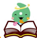
埼玉県社協マスコット 「シャキたまくん」

埼玉県社会福祉協議会に寄せられた県民の皆様からの寄付金を財源として、県内の地域福祉を積極的に推進する団体等が行う創意工夫のある活動に対して助成を行い、地域における民間社会福祉活動の推進と振興を図ることを目的としています。