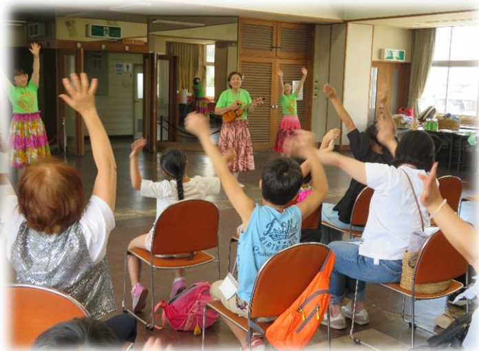
🎵サロンのみんなで大盆踊り♪