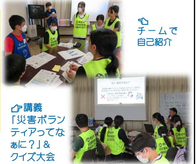
🏠 チームで自己紹介

「災害ボランティア」についての講義とクイズ大会の後、3チームに分かれて、①土のう作り体験 ②畳上げ体験（水害でぬれた本畳） ③土のうじょうご作り（工作）の3種の体験に、小学生親子～大学生が挑戦しました。