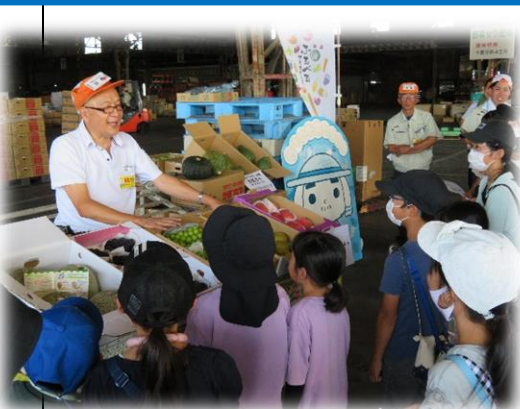
♡活気のあるせりを再現！