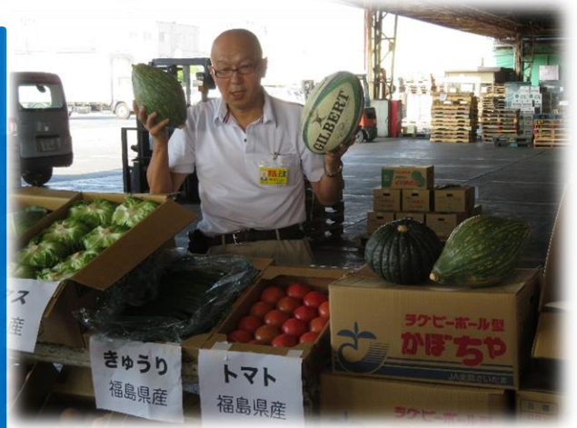
♡初めて見た～！ラグビーボール型のカボチャ★

高齢者の買い物支援と見守りを兼ねた移動販売「あんしん市場」で、新鮮な野菜や果物を市内各所にお届けし、地域貢献してくださっている「熊谷青果市場」さん。普段入れない市場で、大きな冷蔵庫内や野菜の袋詰めを見せてもらったり、せりに参加したり…貴重な体験をさせていただきました。野菜や果物の食べ頃の見分け方も教わり、勉強になりました♪