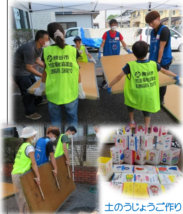
土のうじょうご作り