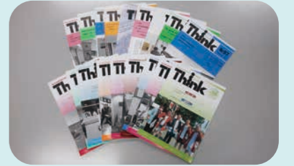
会員事業所向けに協会の活動、会員事業所紹介等の情報をお届け