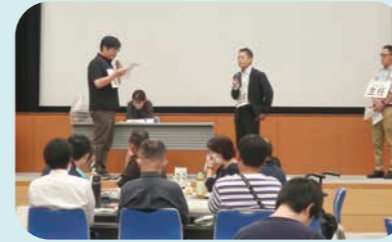
会員事業所利用者・支援者向け虐待防止研修のようす