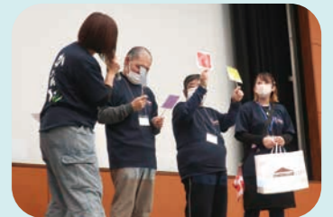
利用者部会発表会のようす

障害のある当事者の方々の思い、目標、取り組み、成果などを発表「利用者部会発表会」