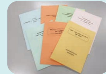
調査研究の報告書を会員事業所へ配付