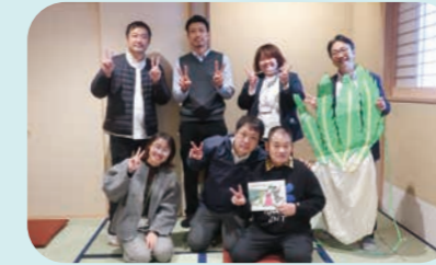
小中学生向けの障害福祉の啓発活動への取り組みのようす