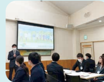
県外視察研修のようす