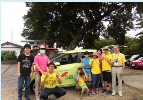
障がい児・者の移動支援に