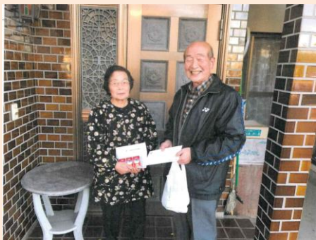
高齢者の見守り活動に