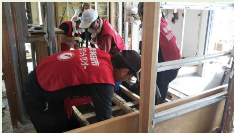
大規模災害のボランティア活動に