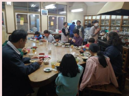
こども食堂の支援に