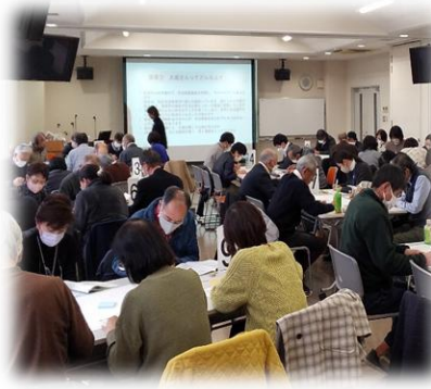
市町村社協職員向けの研修

*認知症や障害によって判断能力が十分でない方のために、金銭管理や福祉サービスの利用を支援する事業