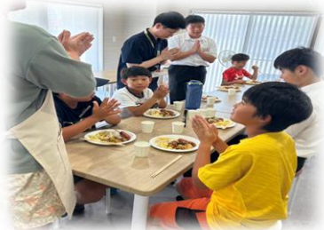
こども食堂への活動支援

地域福祉を推進する専門職の育成のための研修やボランティア活動・福祉教育の推進に取り組んでいます。