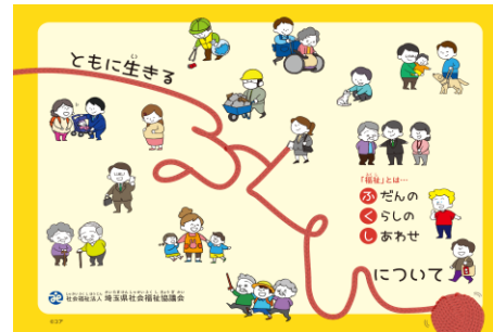
福祉教育パンフレットの作成