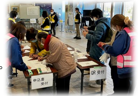
災害ボランティアセンター設置訓練

福祉専門職で構成される「災害派遣福祉チーム」の研修を行い、支援スキルの向上を図っています。