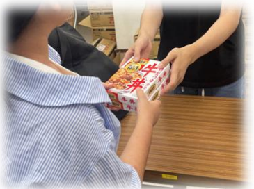
こどもたちへの食料の支援

こども食堂等の運営団体に活動費の助成（年間約200団体）や現場体験プログラム等を実施しています。