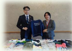
企業からの衣類寄贈

皆様から寄せられた会費や寄付金等は、本会が取り組んでいる様々な地域福祉推進事業の財源として大切に活用させていただきます。