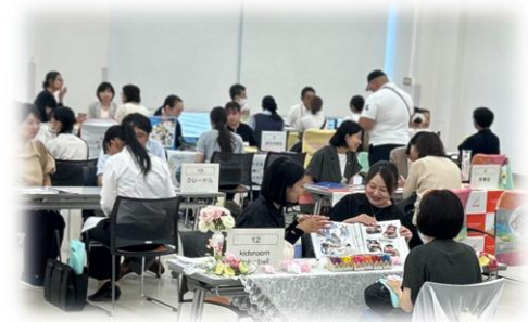
就職フェアによる就職支援