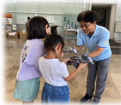
こどもたちへの衣類の支援 (社会福祉法人による社会貢献活動)

社会福祉施設等を対象とした経営相談や社会福祉法人による社会貢献活動の推進をしています。