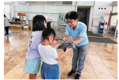
上里町社協主催のフードパントリーで衣類を渡す様子