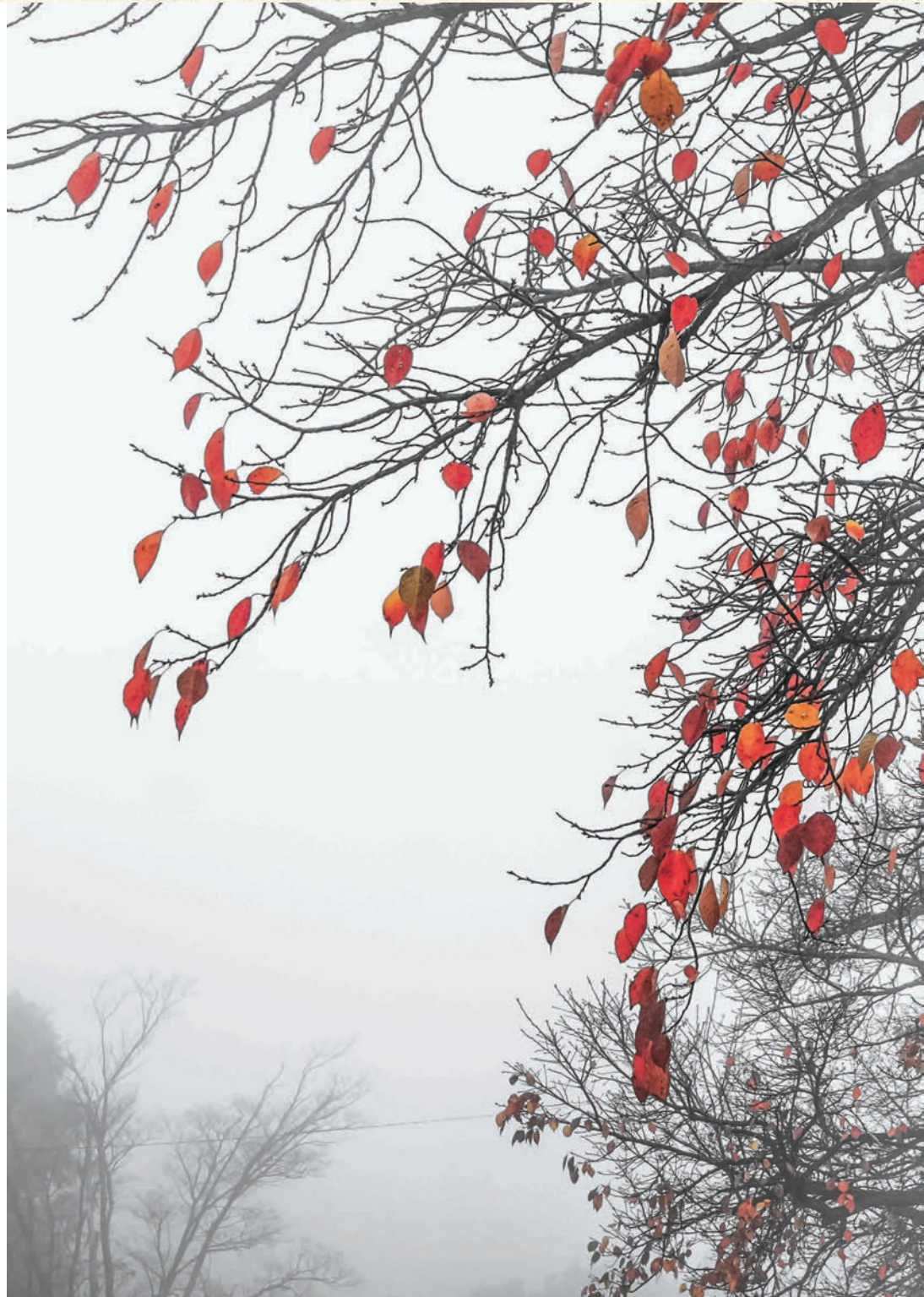
埼玉県社会福祉協議会フォトコンテスト 入賞作品 「朝霧に煙る」 須田 昭二さん（上尾市） 撮影場所…上尾市