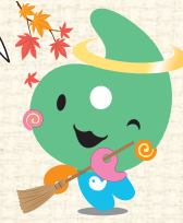
埼玉県社協マスコット 「シャキたまくん」