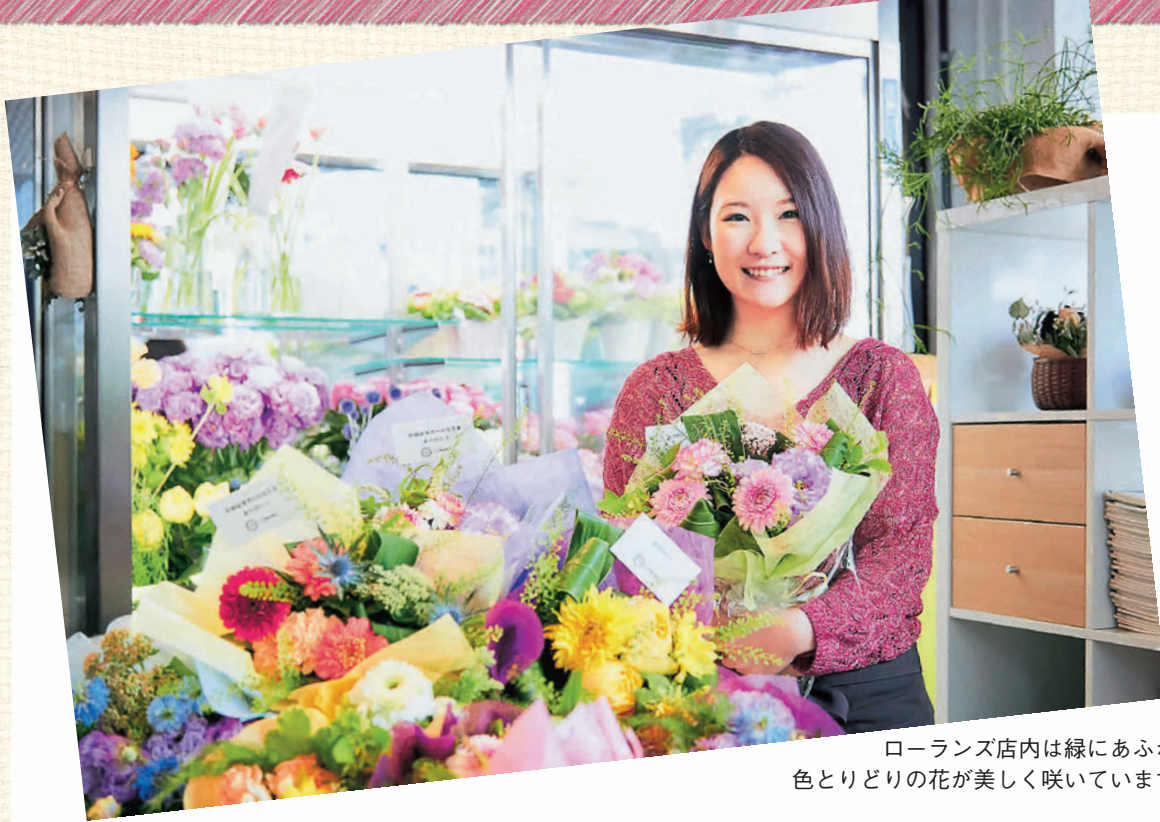
ローランズ店内は緑にあふれ、色とりどりの花が美しく咲いています。

す。体調の変化もよく分かり、コミュニケーションもとりやすい人数で、それぞれの得意なスキルを掛け合わせながら、最高のパフォーマンスが発揮できるようにしています。