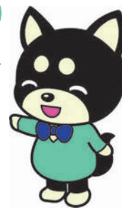
後犬(こうけん)ちゃん