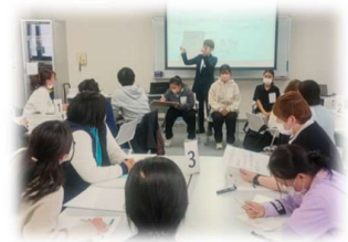
日本語ワークショップの様子