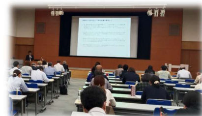
従事者向け研修の様子