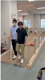
PR隊による ショート動画