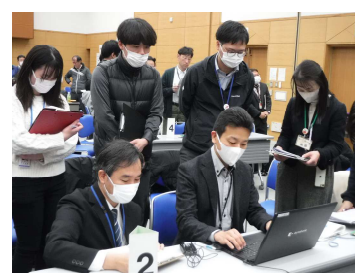
システムの操作体験の様子