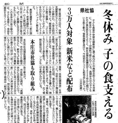
読売新聞 12月31日朝刊掲載