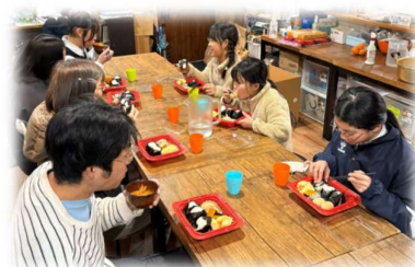
こども食堂が地域の拠り所に