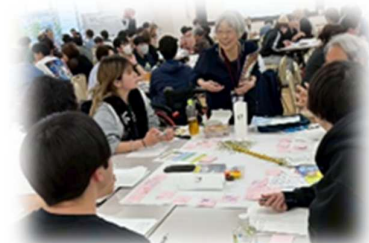
若者と一緒に地域共生社会を考える研修の様子