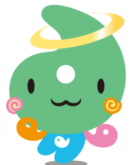
埼玉県社協マスコット 「シャキたまくん」