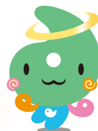
埼玉県社協マスコット 「シャキたまくん」