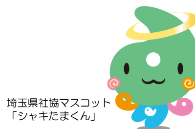
埼玉県社協マスコット 「シャキたまくん」