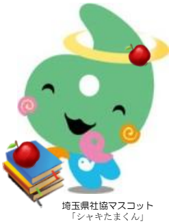
埼玉県協会のキャラクター「シャキたまくん」